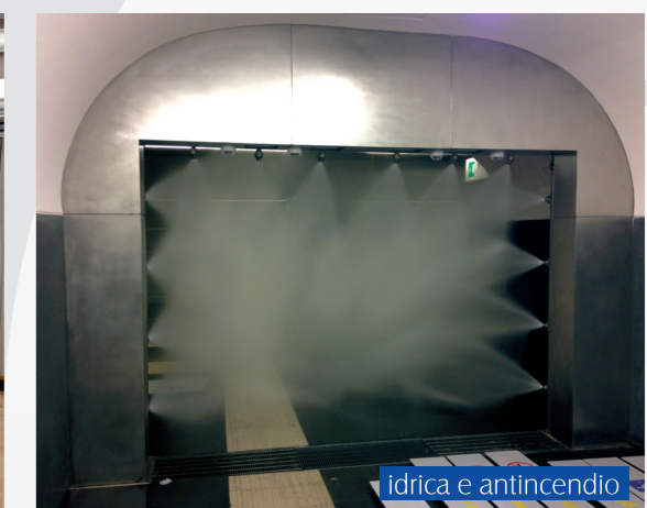
idrica e antincendio