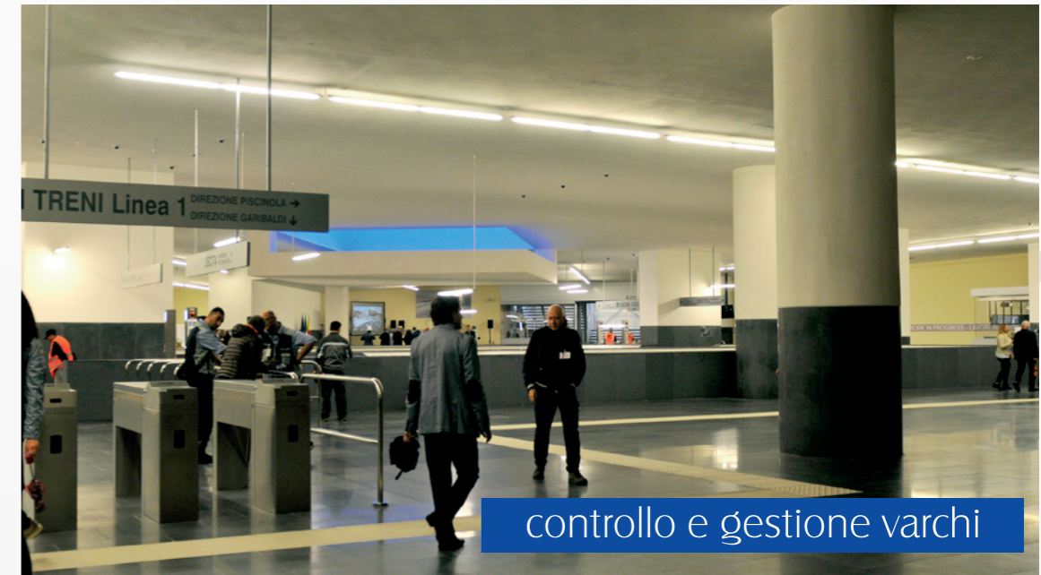
controllo e gestione varchi