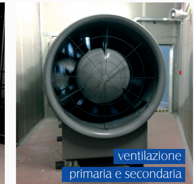
ventilazione primaria e secondaria